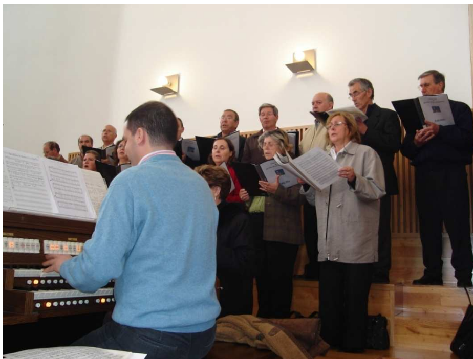
Participação na Eucaristia em Macedo de Cavaleiros

Assinale-se, ainda, a participação episódica em cerimónias de casamentos e funerais e outras cerimínias e eventos de cariz religioso.