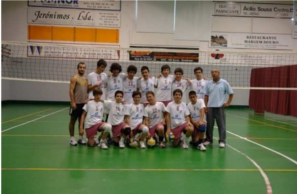
Equipa da Ala de Infantis Masculinos Campeã Regional