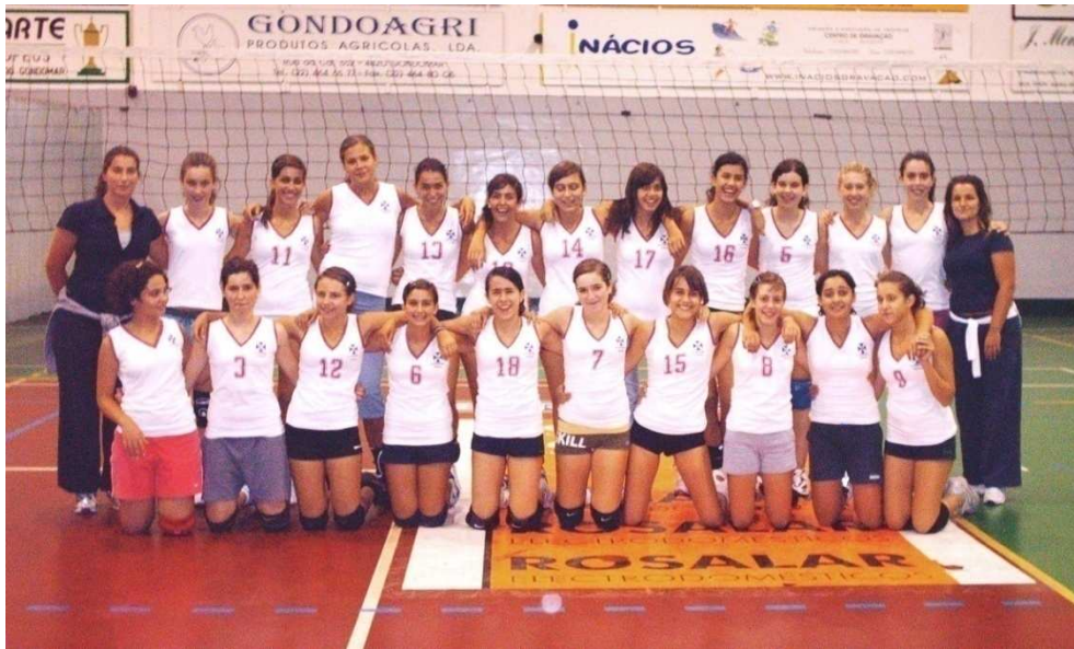
Equipa da Ala de Iniciados Femininos Campeã Regional